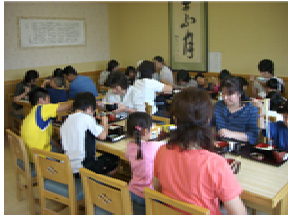
佐藤養助商店さんで、出来立て稲庭うどんを食べました。美味しかったです！