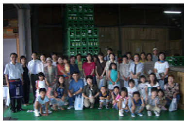
秋田清酒さんにて、全員でパチリ！

今年度当会は設立10周年(平成9年3月設立)を迎え、その記念事業の第1弾として、「あきた県南産業観光ツアー」を8月1日に開催し、小中学生から一般の方々を対象に、定員20名募集した所、定員をはるかに超え、35名と多数参加していただきました。 午前9時30分、横手防雪センターを出発し、最初の訪問先「匠の味工房遊心庵」さんでは、工場に案内される前に靴にカバーを、頭にキャップをつけ見学しました。 最先端の工場設計を取り入れた工場で、豆乳、豆腐、ヨーグルトなどを作っている様子を、子供たちは、ガラスに顔を付け、真剣な眼差しで見学していただきました。