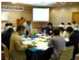
真剣ロールプレイ中！ (貿易実務講座 会場：横手セントラルホテル)